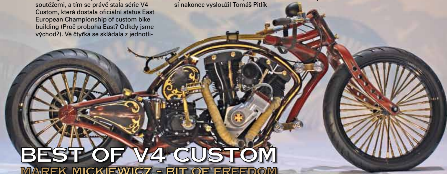
BEST OF V4 CUSTOM MAREK MICKIEWICZ - BIT OF FREEDOM

Fotografie všech uvedených motorek najdete na www.eurobikefest.cz