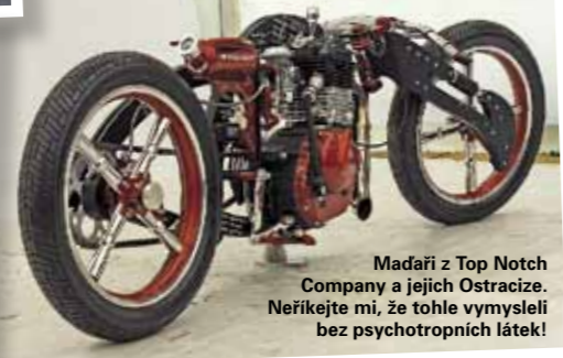
Maďari z Top Notch Company a jejich Ostracize. Neříkejte mi, že tohle vymysleli bez psychotropních látek!